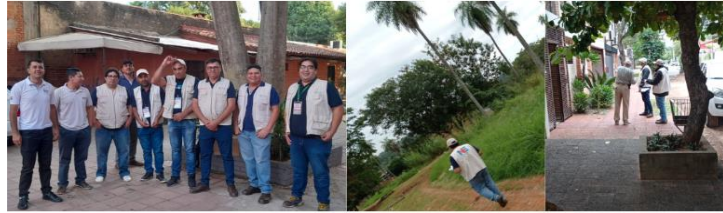
c. Directorio General de Empresas (DIRGE):