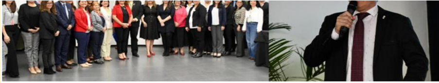
Atlas Ambiental de Paraguay