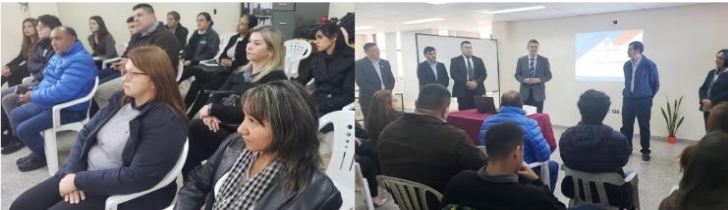
e. Encuesta de Turismo Receptivo 2023 (ETR):